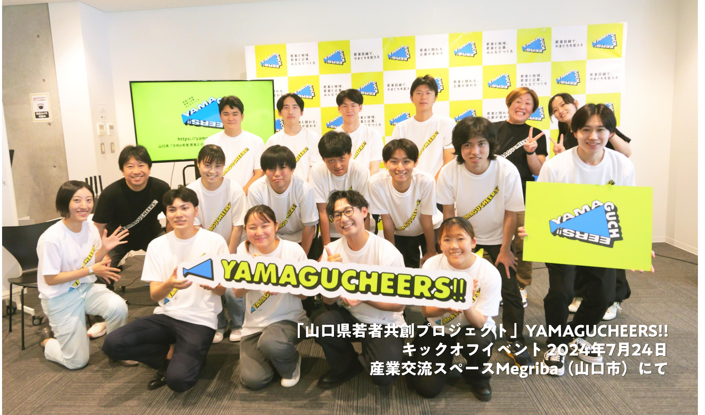
「山口県若者共創プロジェクト」YAMAGUCHEERS!! キックオフイベント 2024年7月24日 産業交流スペースMegriba (山口市) にて